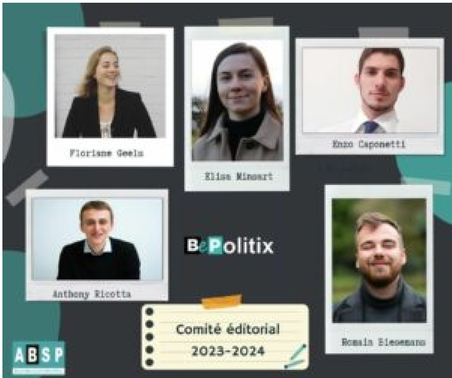
Equipe éditoriale © BePolitix