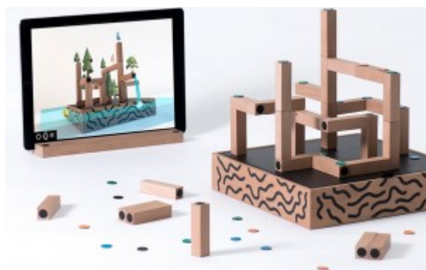
Koski: le jeu. (Cliquer pour agrandir)

Koski , qui remporte le troisième prix, est une entreprise basée à Londres (Royaume-Uni). Elle propose un jeu de construction à mi-chemin entre le monde physique et le monde digital. Il se compose d'un plateau, d'éléments en bois, de pastilles de couleur et d'une application virtuelle, qui agit comme une sorte de miroir augmenté des objets précédemment cités.