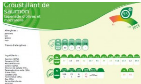
YouMeal, exemple d'application.

Enfin, YouMeal joue la carte de la gastronomie intelligente en proposant un logiciel qui marie l'alimentation et la technologie. But de l'exercice: proposer une analyse nutritionnelle de ce que nous avalons, son impact sur la santé mais aussi sur l'environnement.