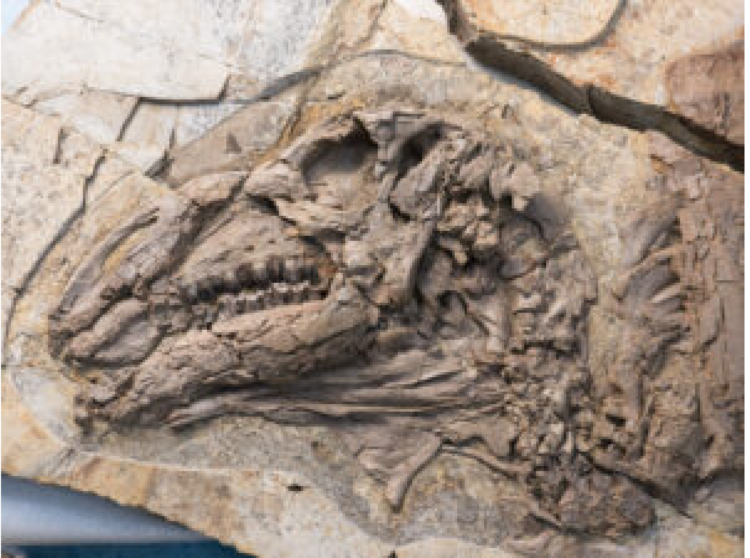
Haolong dongi