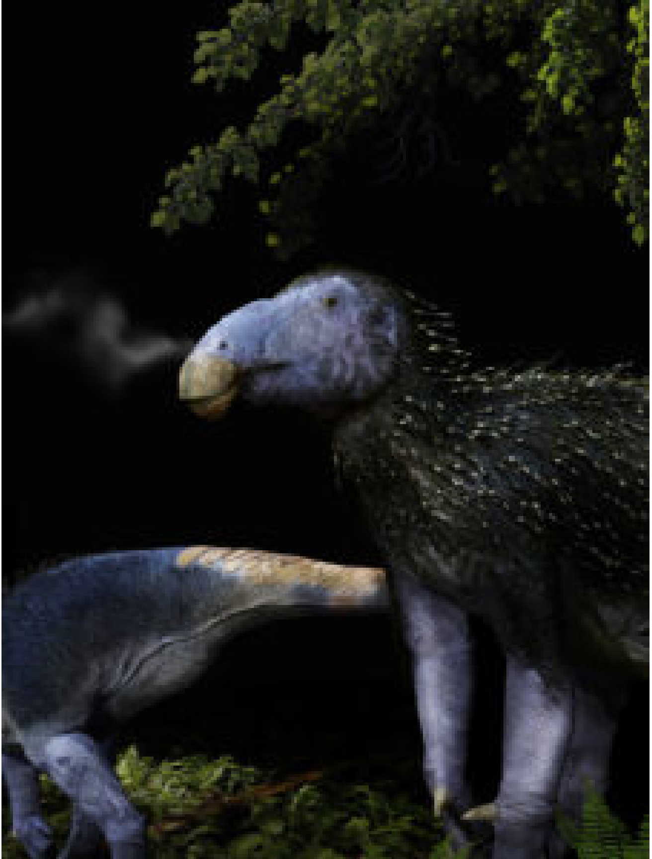
Représentation artistique de la nouvelle espèce Haolong dongi épineux © Fabio Manucci