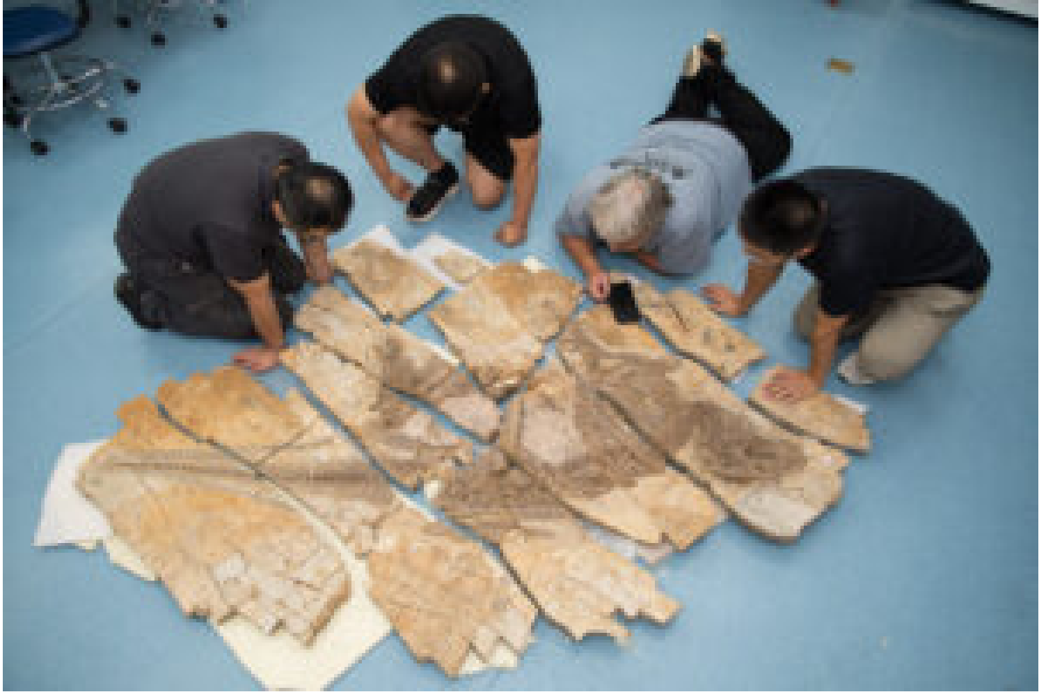
Une partie de l'équipe de recherche, avec Pascal Godefroit (t-shirt bleu), auprès du squelette exceptionnellement bien conservé