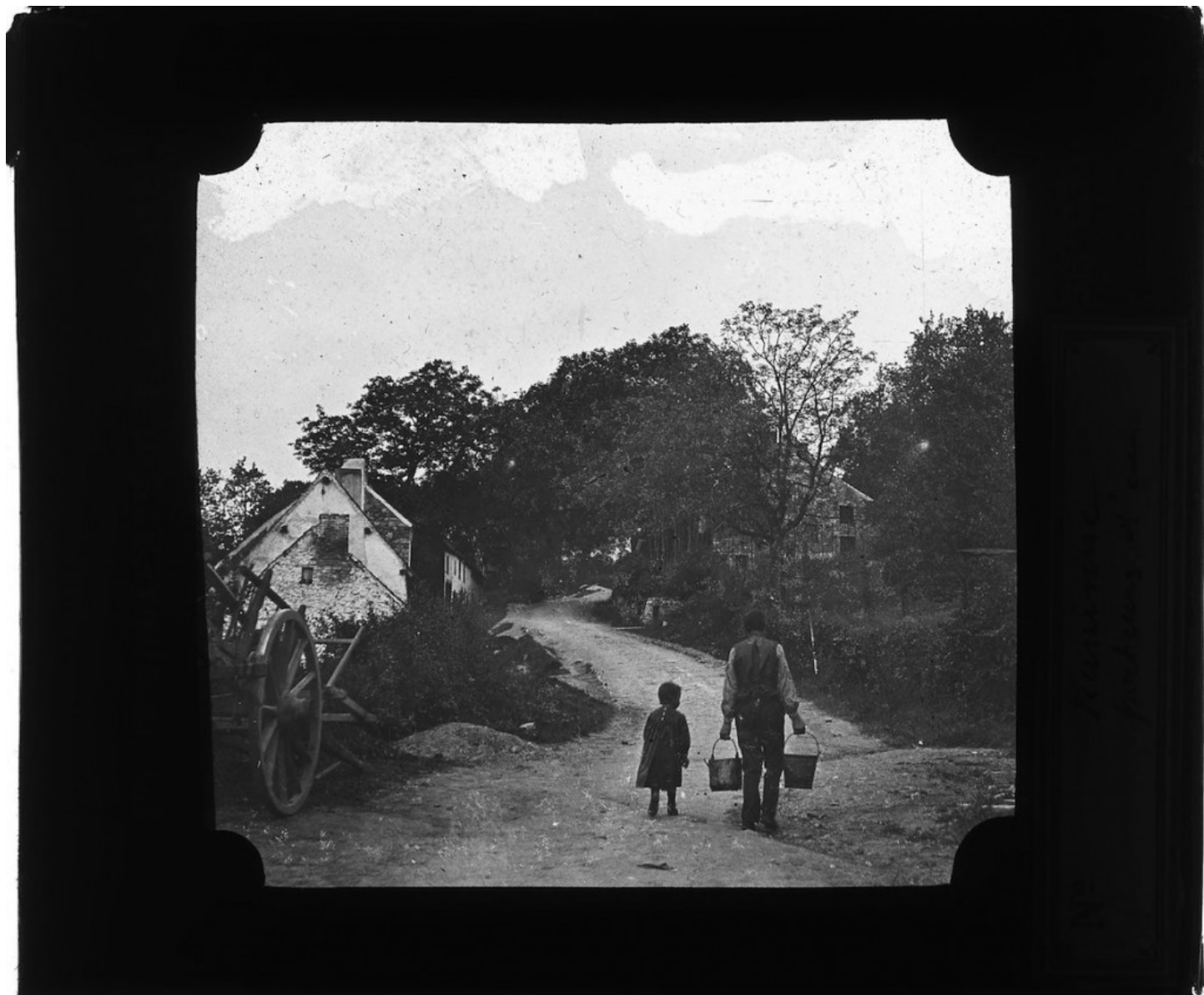
Porteur d'eau à Naninne.