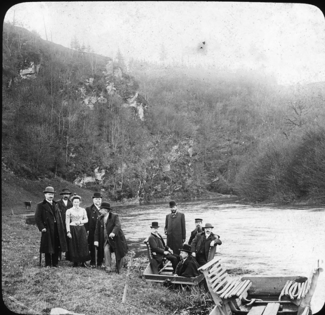
L'embarcadère, à Chiny.

En dehors de cette face visible des activités de l'association, un travail de fond a également été entrepris par les bénévoles. Ceux-ci ont débuté l'identification des photos, leur inventoriage et leur numérisation systématique. Il s'agit là d'un travail patient, parfois ingrat, mais riche en trouvailles.