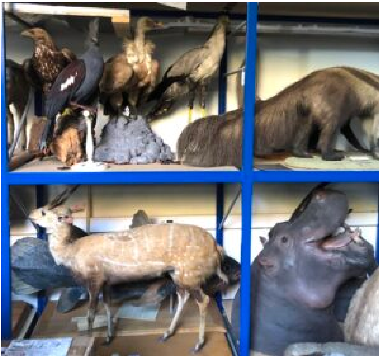
Musée de zoologie de l'ULiège collection en réserve durant les travaux