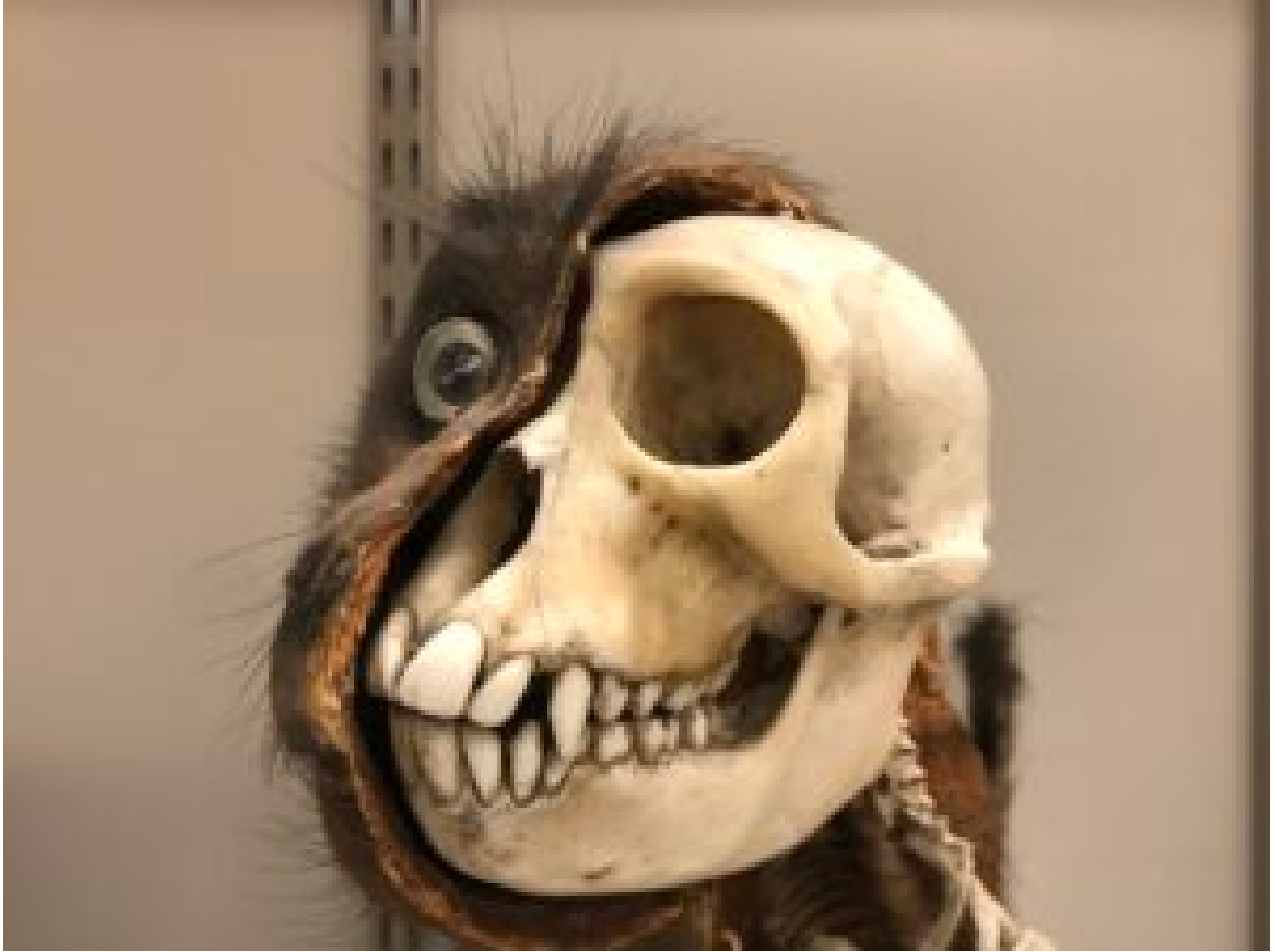
Musée de zoologie et anthropologie de l'ULB