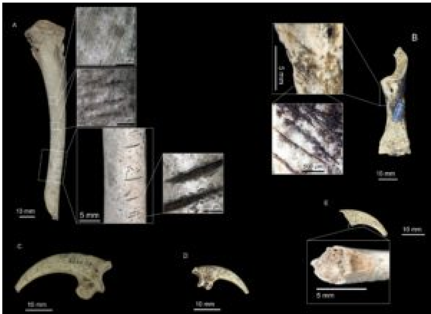
A et B. Os de harfang des neiges de la grotte du Trou de Chaleux avec des marques de découpe. D. Griffes polies d'un harfang des neiges. C. Griffes polies d'un aigle royal. E. Griffes cassées d'un harfang des neiges