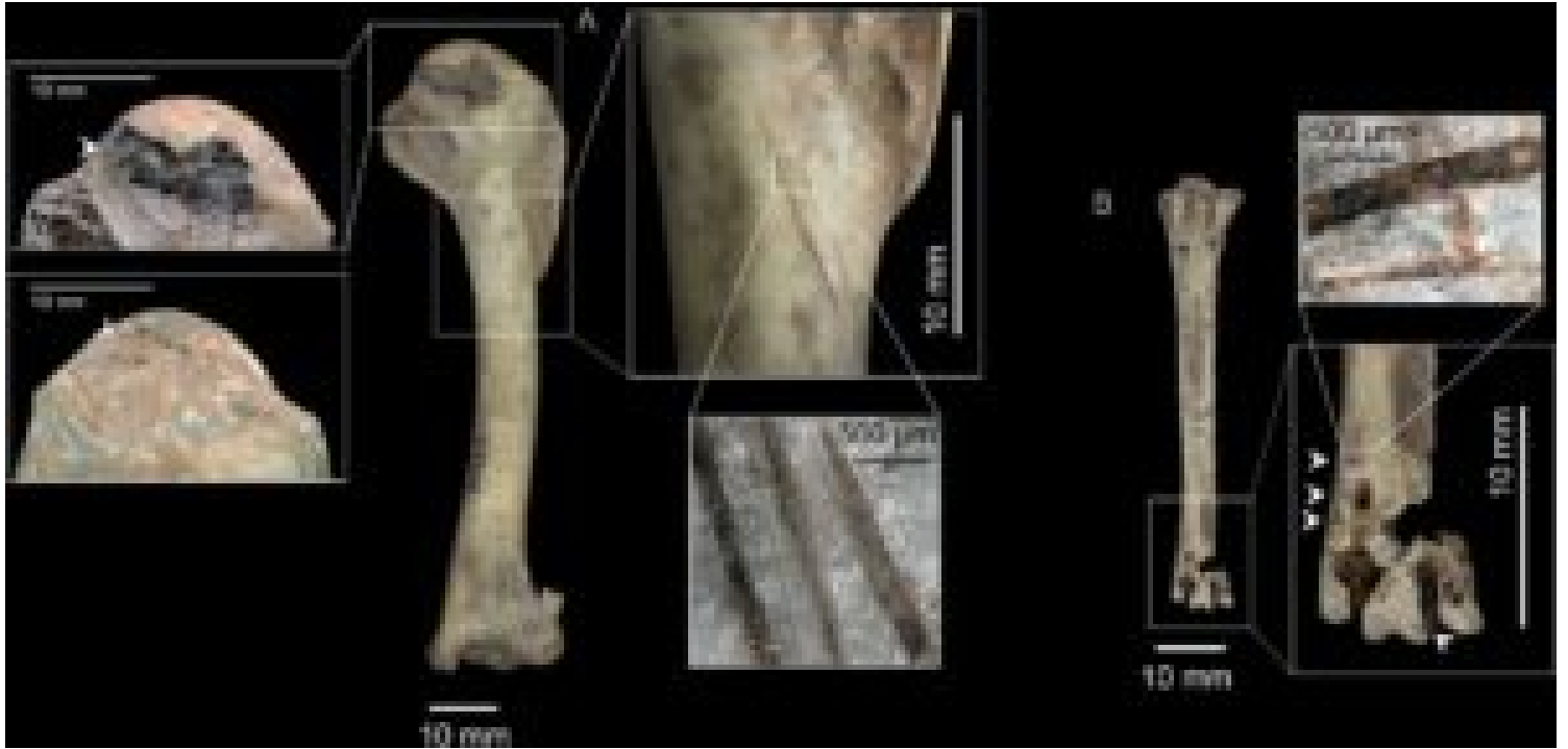
B. Os de corbeau avec doigts enlevés. A. Le corbeau a probablement aussi été mangé : il y a des traces de découpe pour enlever la chair et des traces de morsure Au Trou de Chaleux, la découverte de griffes d'aigle royal et de harfang des neiges présentant des polis suggérant qu'ils ont été portés par l'Homme, renforcent la valeur symbolique possible de ces grands oiseaux.