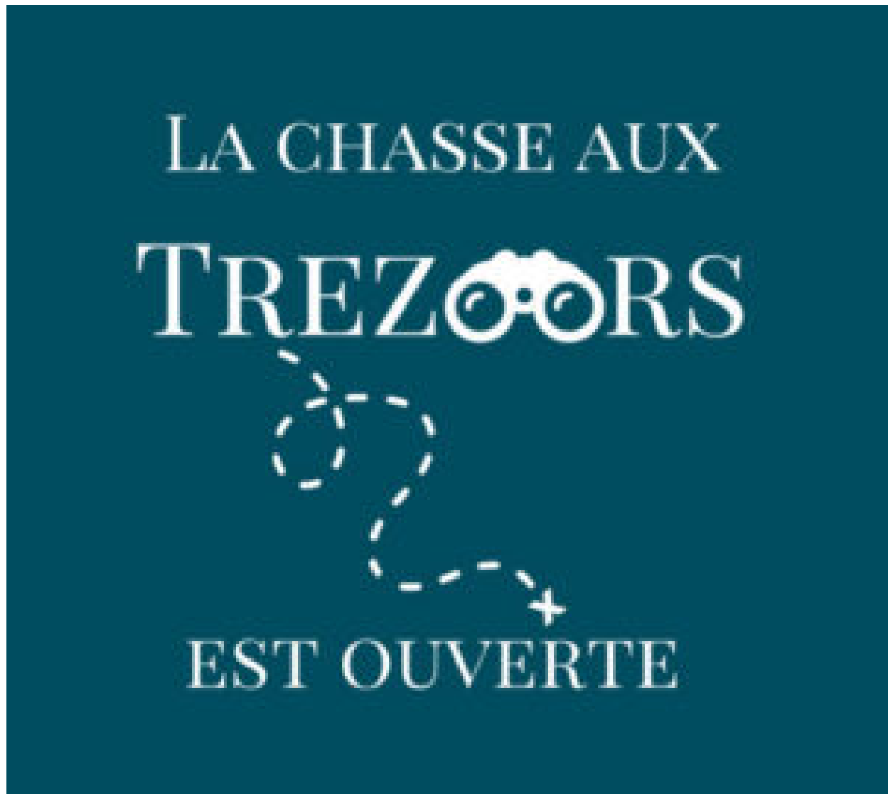
Capture d'écran de l'app Trezors