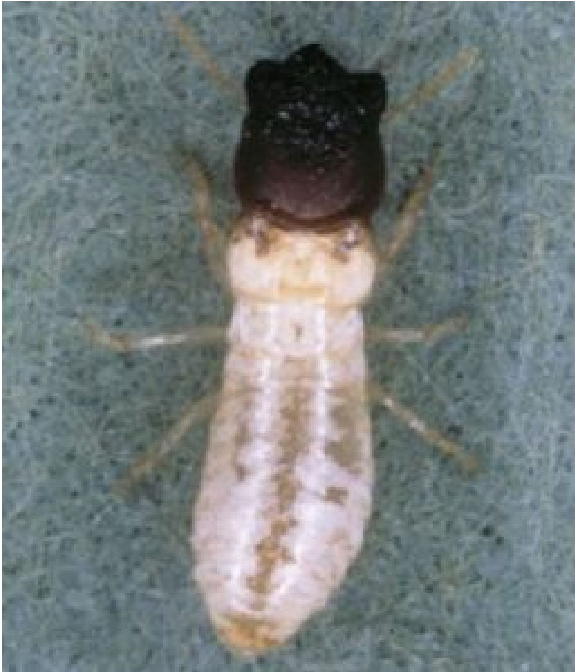
Termite de l'espèce Cryptotermes brevis - libre de droit