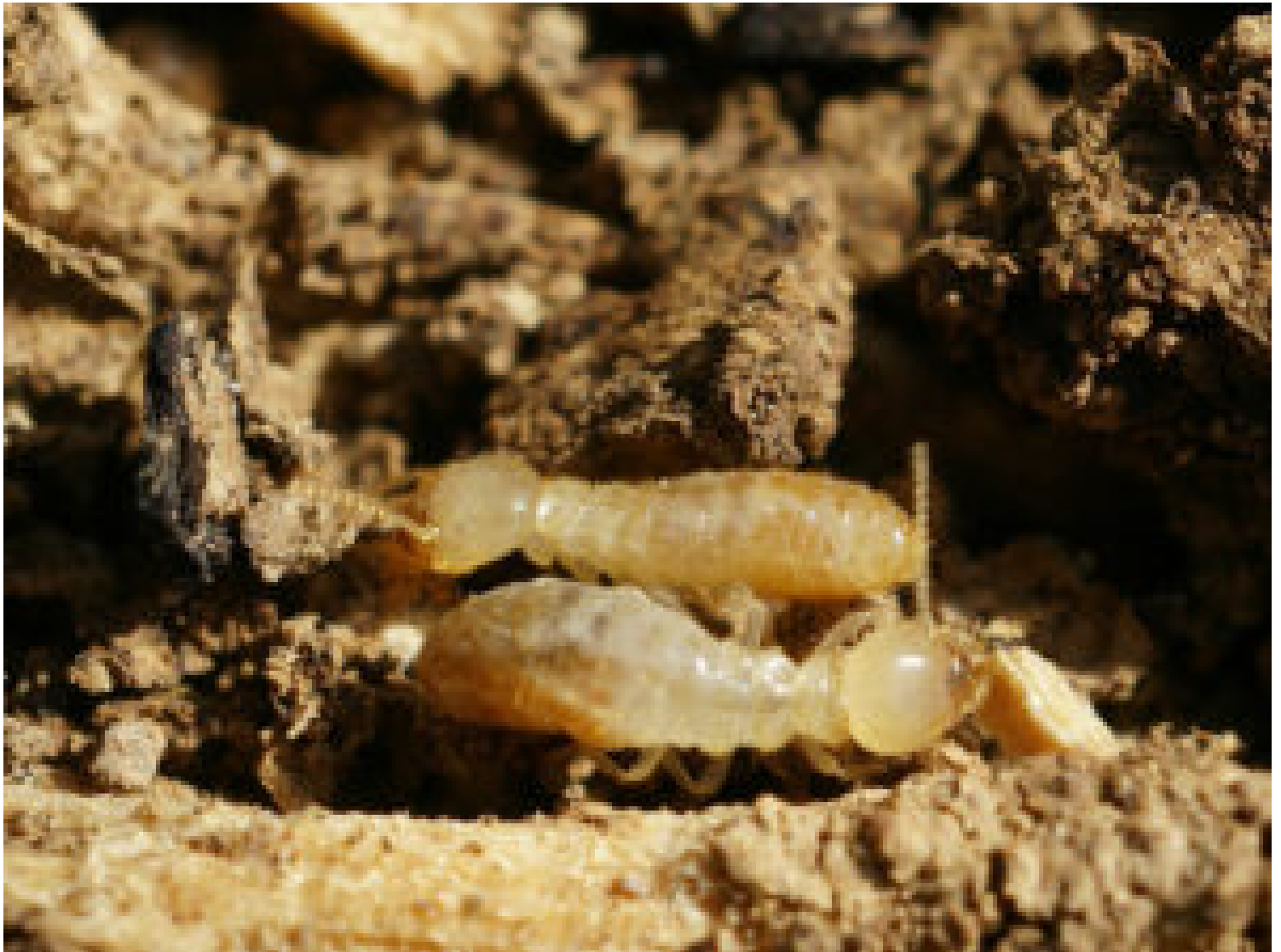
Termites de l'espèce Reticulitermes banyulensis

chercheuse au département de Taxonomie et phylogénie de l'IRSNB, et première autrice du rapport.