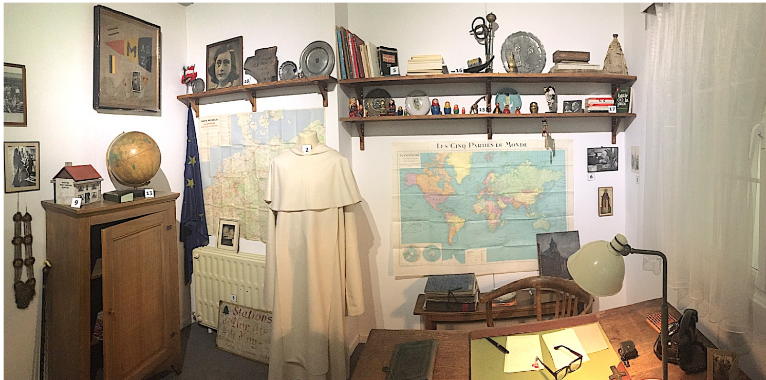
Reconstitution du bureau du Père Pire.