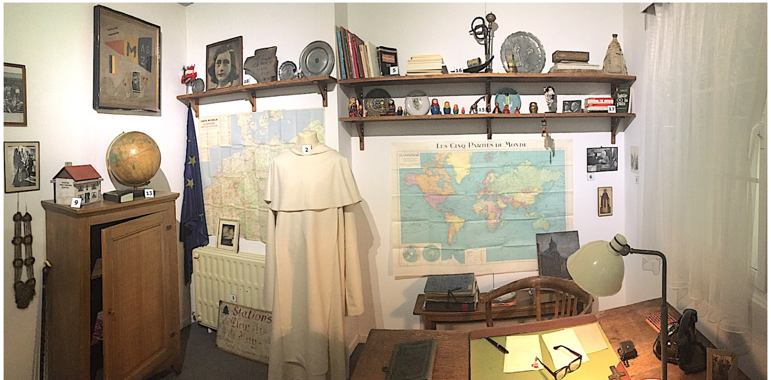
Reconstitution du bureau du Père Pire.