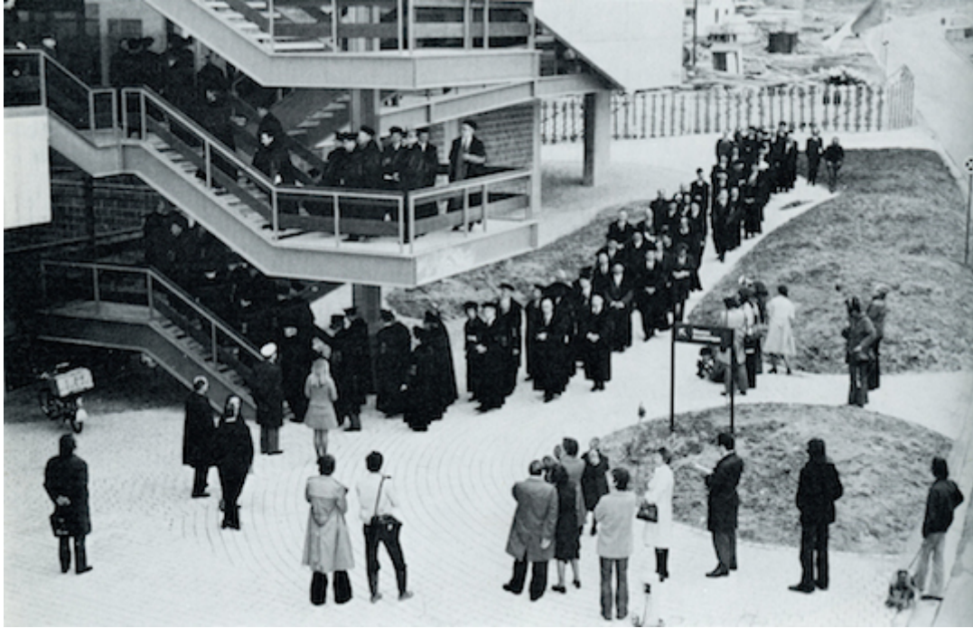
UCL/Woluwe : première rentrée académique 1974