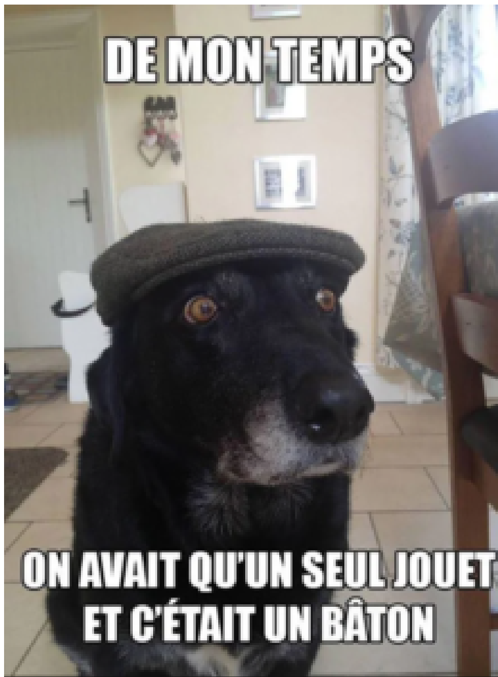
Exemple de mème