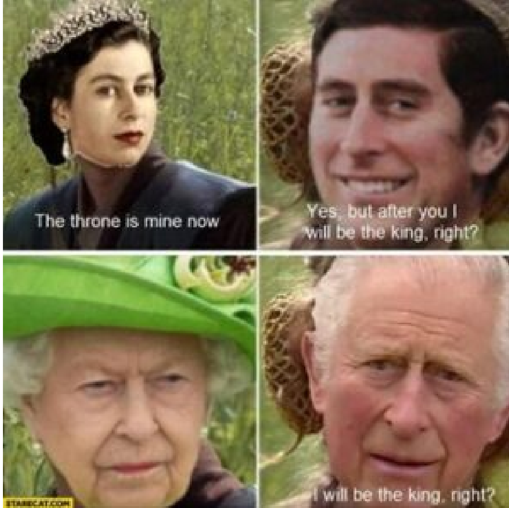
Exemple de mème