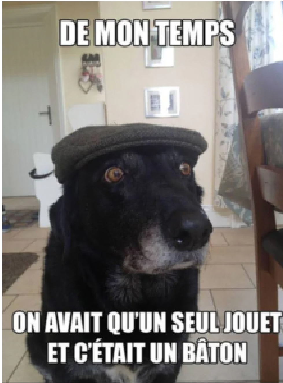
Exemple de mème