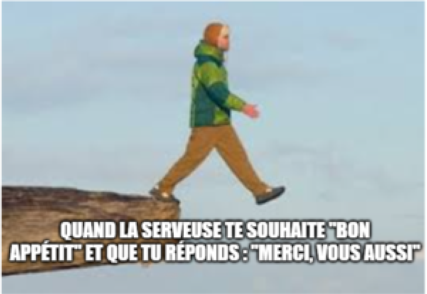
Exemple de mème