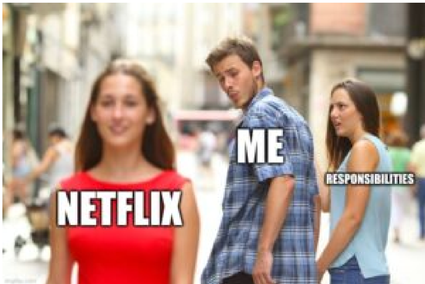
Mème "distracted boyfriend"

un domaine qui n'a rien à voir avec celui des relations personnelles. On peut, par exemple, faire référence au monde politique, économique, ou encore musical. » En résumé, une image ne devient un mème qu'à partir du moment où il y a une réappropriation visant à produire un discours propre.