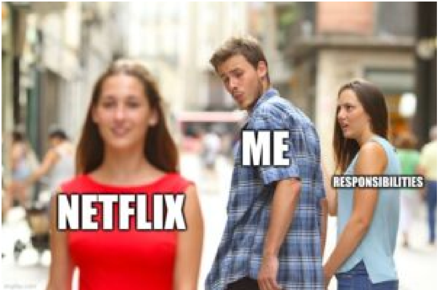
Mème "distracted boyfriend"

un domaine qui n'a rien à voir avec celui des relations personnelles. On peut, par exemple, faire référence au monde politique, économique, ou encore musical. » En résumé, une image ne devient un mème qu'à partir du moment où il y a une réappropriation visant à produire un discours propre.